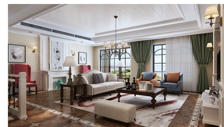
学生作品一室内装饰设计

本专业主要面向环境艺术设计企业，设计院、城建规划部门等培养从事城市小区规划、景观设计、灯光设计、绿化设计及环境艺术施工管理工作的高级专业人才，社会需求量较大。