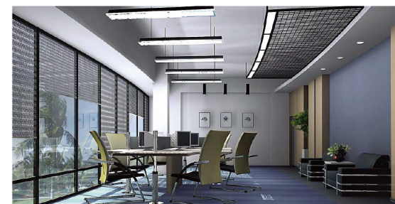
学生作品一办公空间设计