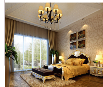
学生作品一室内装饰设计