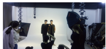
艺术设计学院摄影工作室