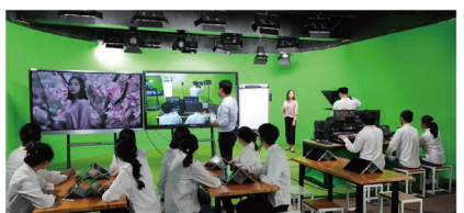
艺术设计学院融媒体工作室