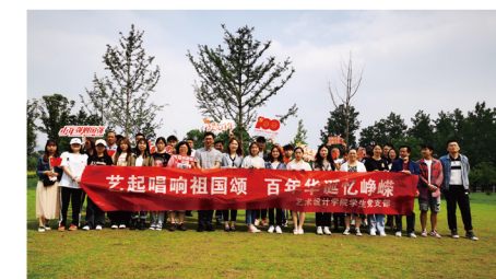
艺起唱响祖国颂主题党日活动