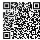
艺术设计学院公众号