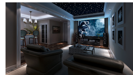
学生作品一室内装饰设计