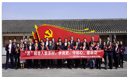
艺术设计学院教师合影

学院环境艺术设计专业与江苏第二师范学院、南京传媒学院建设3+2专本联合培养项目，并先后与南京艺术学院和南京理工大学合作开展专接本、自考助学本科教学，为学生在校获得本科学历学位提供了渠道，已有本科毕业生成功考取研究生，为事业可持续发展奠定了良好基础。