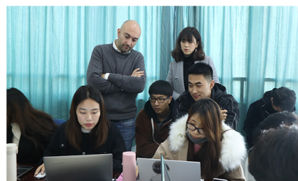
意大利设计师sani米校工作坊教学